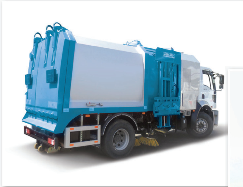
Çöp kasası görünümü Hydraulic garbage compactor side