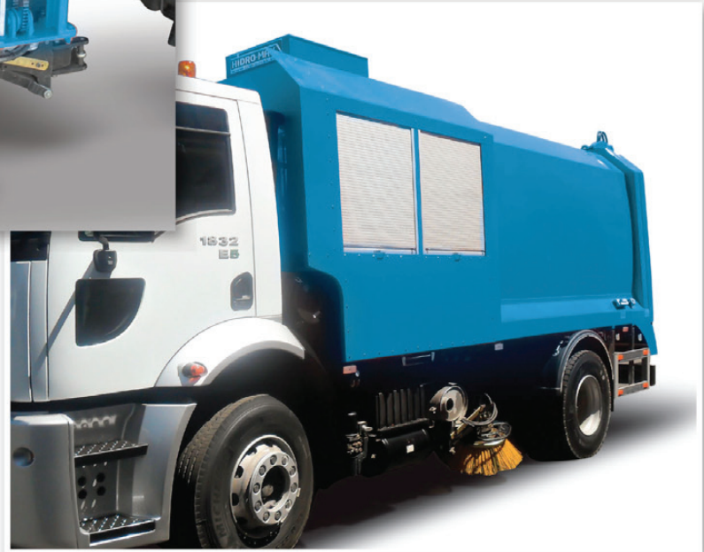
Vakumlu süpürge görünümü Vacuum cleaner side

Hidro-mak Ford ve Mercedes markalarının onaylı üstyapıcısıdır. Hidro-mak is notified bodyupit manufacturer of the brands of Mercedes and Ford.