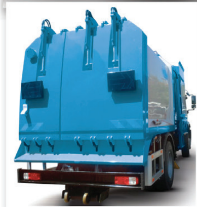
2 ayrı kapak ve bölme sistemi ile pratik boşaltma Practical and easy discharge by means of 2 separate covers and partition system